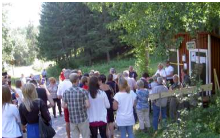
Invigning av Mädans Minimuseum 1