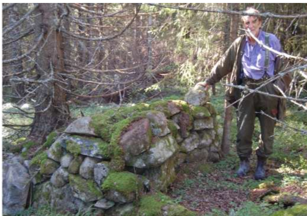
Kan detta vara centrum på den gamla Tingplatsen i Mädan?

Byns överlevnadsgrund har varit marken, skogen, vattnet.