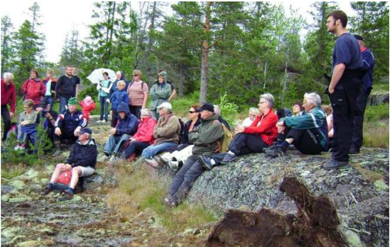
En av många spännande vandringar...