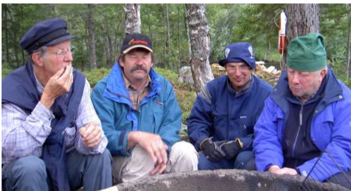
"Ingen tok är en annan lik"

Ett uttryck som genom årtionden, kanske århundraden präglat livet i byn. För det innebär att just för att vi är olika och kanske drar åt olika håll så kan det ändå vara en tillgång om tokerierna vänds i rätt riktning. Och tokar har genom historien varit alla de kreativa människor som stuckit ut, vägrat följa strömmen och vågat gå sina egna vägar. Då och när man sedan lyckats att få tokarna att dra åt samma håll, har sociala gemenskaper kunnat förskjuta berg och starta nya möjligheter och livsbetingelser. Så precis som det ska vara är människorna i byn, byns största tillgång och resurs. I Mädan har vi under de senaste 2 decennierna tagit fasta på detta, med början under den tid byn befolkningsmässigt nådde sin lägsta nivå under överskådlig tid. Som minst var det ca 15 vinterboende i byn, mest äldre.