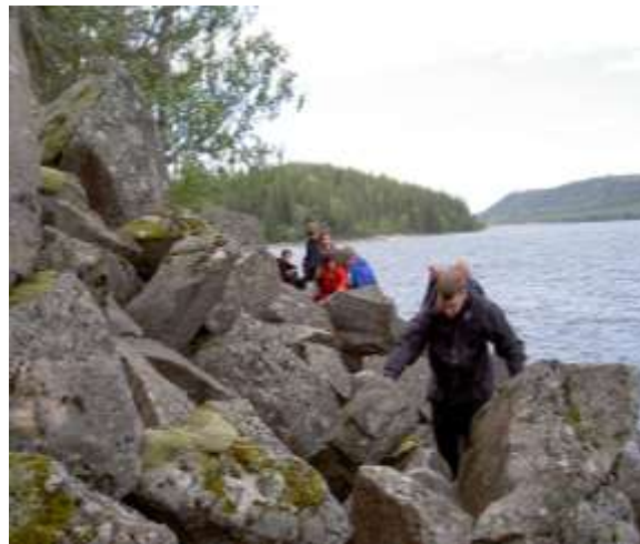
En av många spännande vandringar...