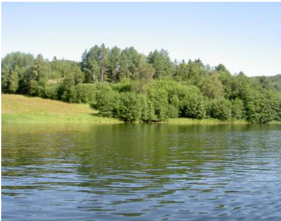
Tilltänkt mark för Båthamn

För byn i sin helhet ser vi nya båthamnen med intilliggande tomtområde som en viktig hörnsten i vår medvetet skapande infrastruktur (se övriga föreningars aktiviteter), inte minst för att locka nya aktiva människor att vilja bosätta sig i vår by. I detta projekt ingår också att dels via gästbåtplatser och dels via avstickare från Höga Kustenleden ge besökare från alla världens hörn möjlighet att den vägen ta del av utsikterna i byn.