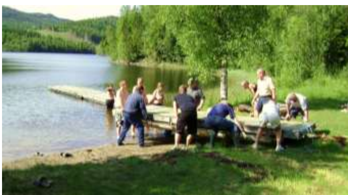
Bryggnedläggning. Badplatsen i Bäcksvöja