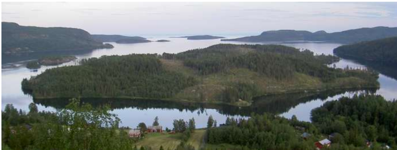
Långsön, utsikt från Rödklitten (Bild från Google Earth)

Mädan ligger i flera avseenden mycket centralt med 10 minuters bilresa till affärer, bank, idrottshall, förskola och skola mm. Det är inte längre till E4:ans infart. Via kommunens flygplats halvtimmen bort når man Europa på några få timmar.