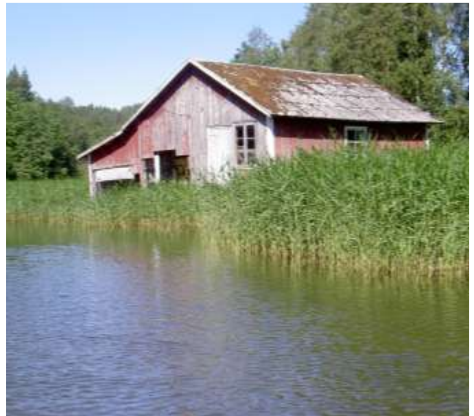
Den sista sjöboden i den uttjanta Sjöboviken.

Redan nu börjar vi se hur skogen sakta tar över ytterligare områden. Men kvar finns potentialen i vår natur som innehåller värden som rätt utnyttjade och tillvaratagna kan skapa nytt liv i byn.