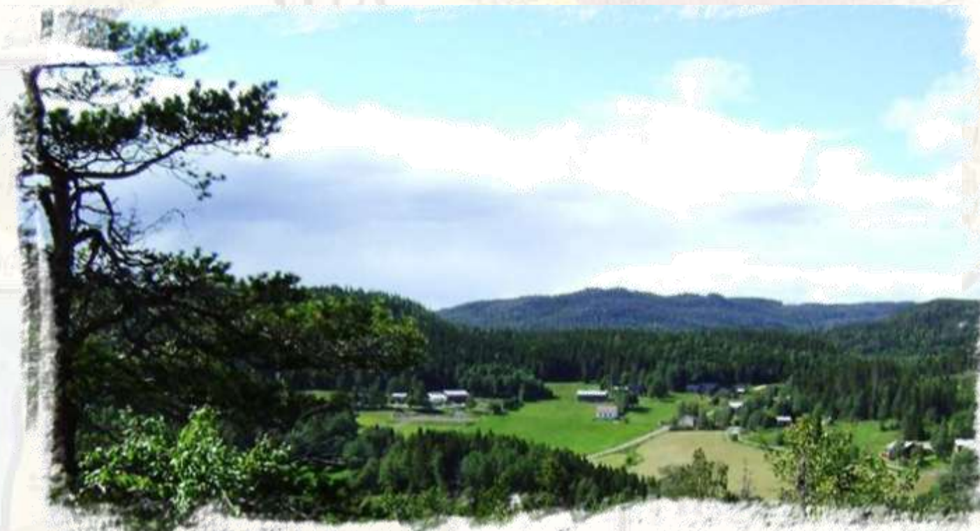
Bild över den ursprungliga byns läge

MÖJLIGHETERNAS BY - MED DESS OÄNDLIGA UTSIKTER.